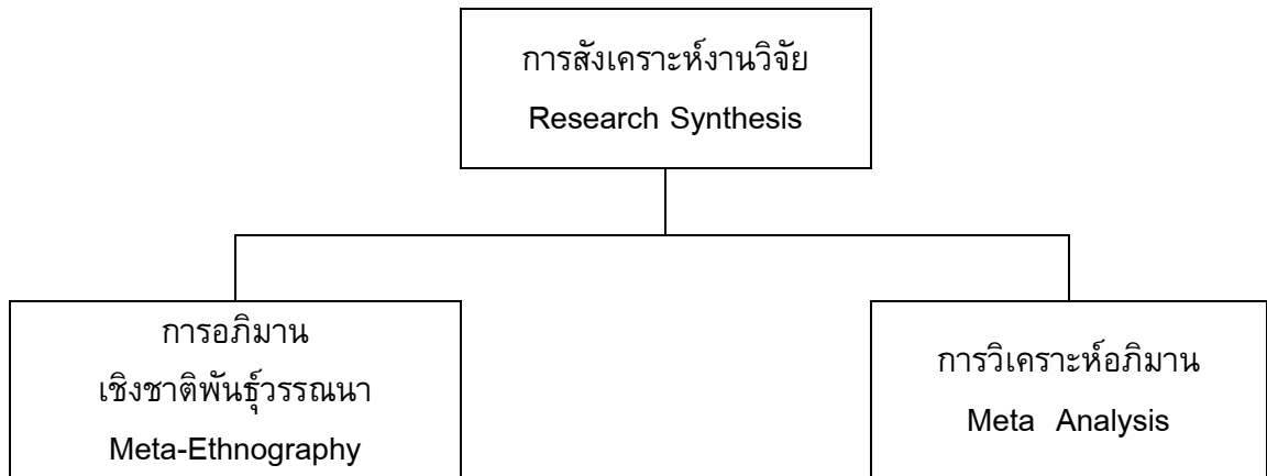
ภาพประกอบที่ 1 แบบแผนการสังเคราะห์งานวิจัย